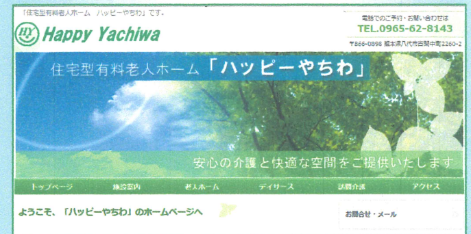
(ホームページ TOP 画面)