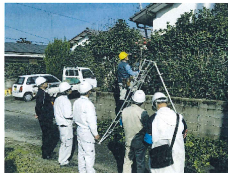
安全パトロールの様子